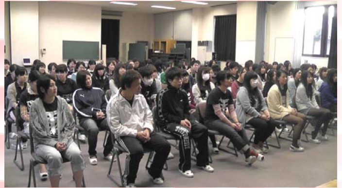
各リーダーより業務評価の発表がありました。