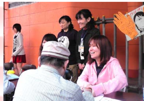
みんなの笑顔がとてもステキです(0)