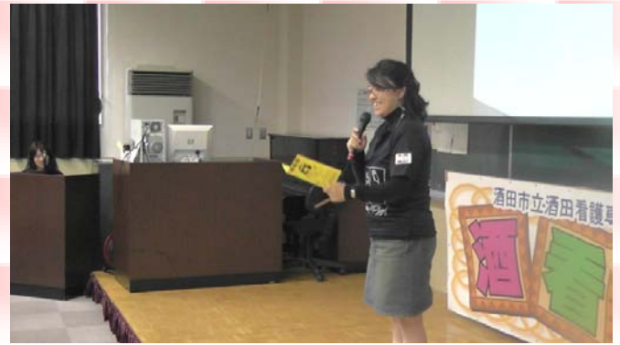
副学校長より講評を頂きました。