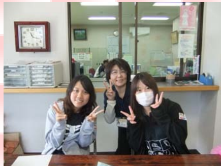
みんな笑顔で待ってます(^o^)