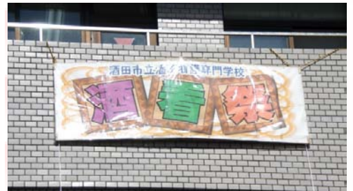
酒看祭の看板もバッチリです