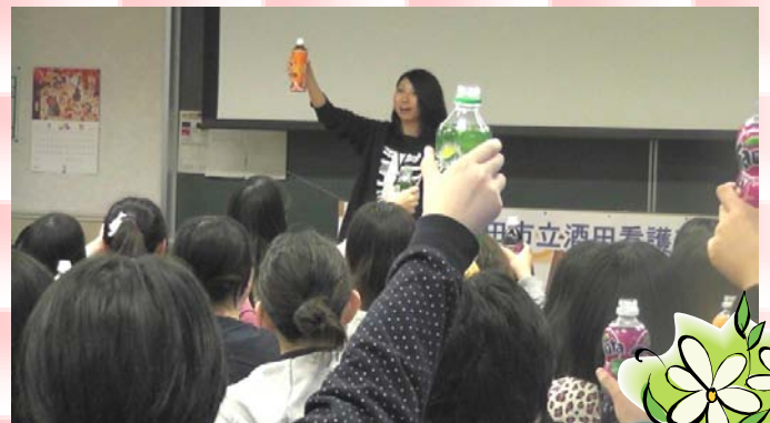
みんなで乾杯をしました。みなさんお疲れさまでした。