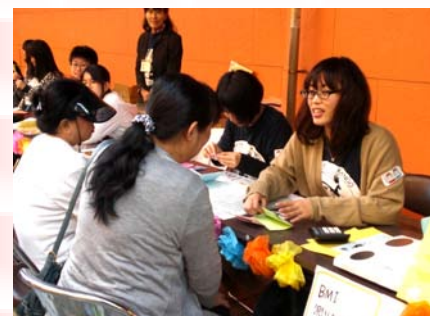
笑顔で説明しています。