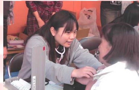
血圧測定、大盛況です。