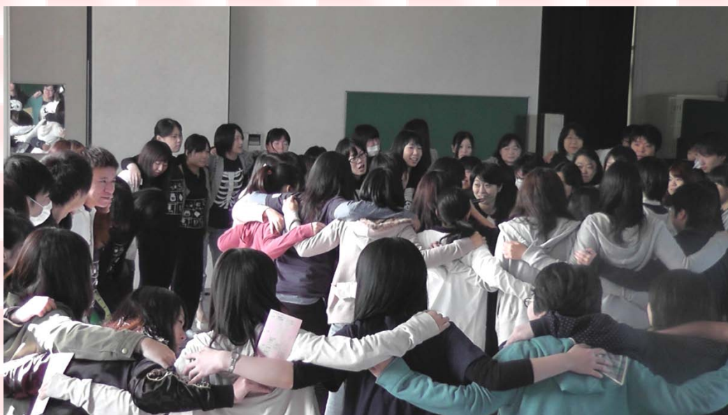
さあ、みんなで頑張ろう！！