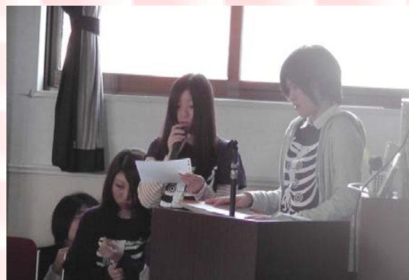
実行委員のあいさつです。