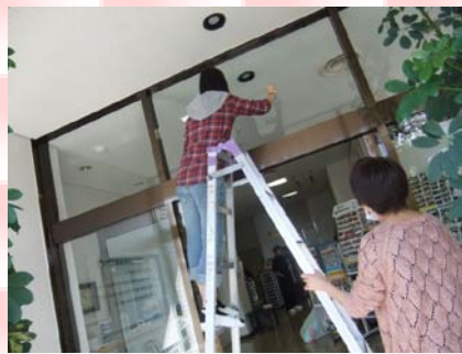
飾りつけも頑張りました!(^)!