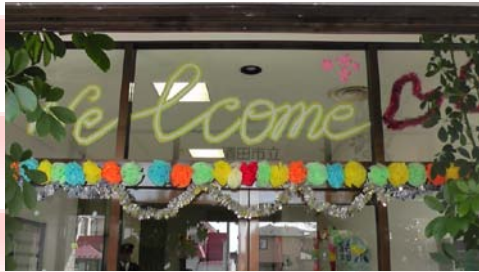
学校の玄関前の飾りつけです