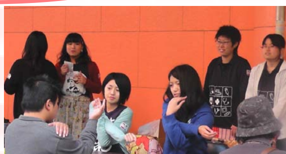
みなさん、喜んで下さいました。