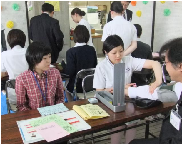
血圧測定、真剣な表情がいいね(^_^)/