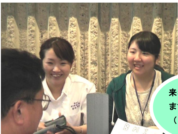
来年も頑張ります！！ (^v^)