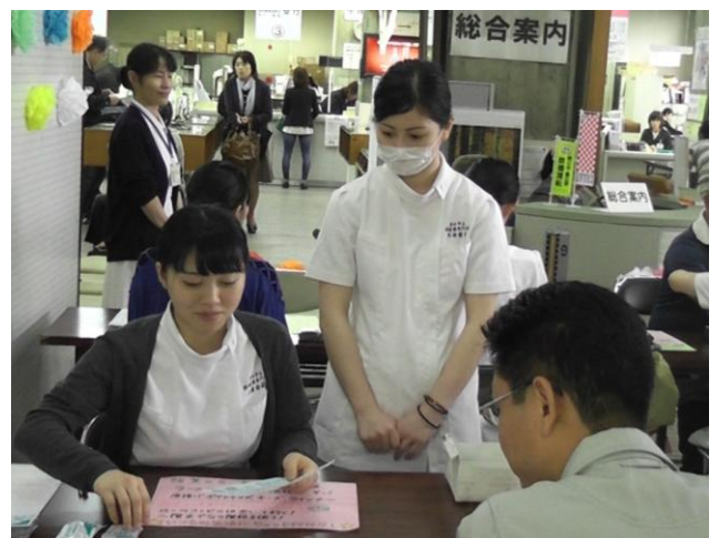
みんなの笑顔がやさしいね(^v^)