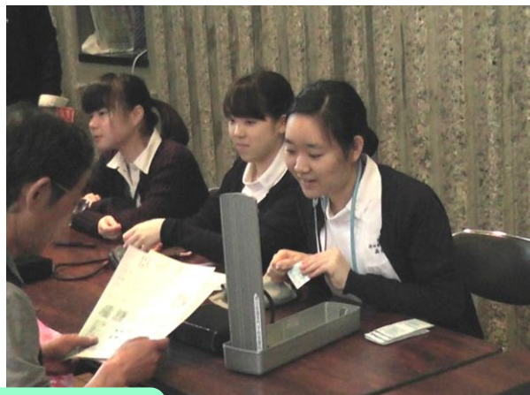
血圧測定の様子です