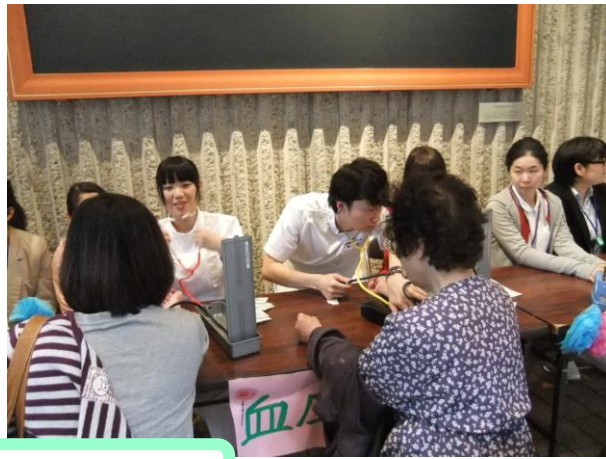
文化センターも大盛況でした(^0^)/