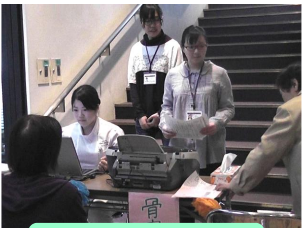
骨密度測定も大人気でした！！