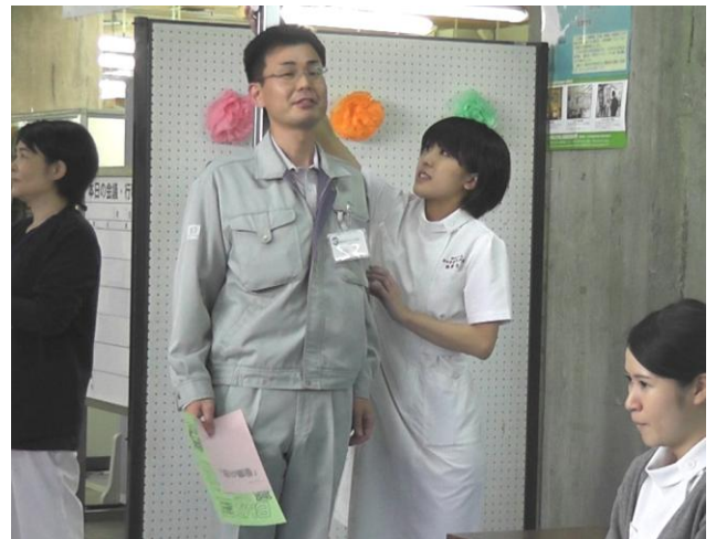
身長測定の様子です