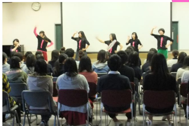
踊りで益々、盛り上がりました。