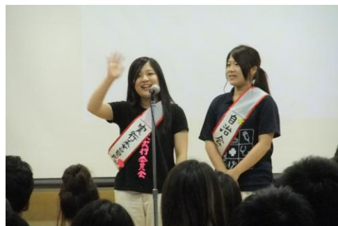
実行委員長と自治会長よりあいさつ