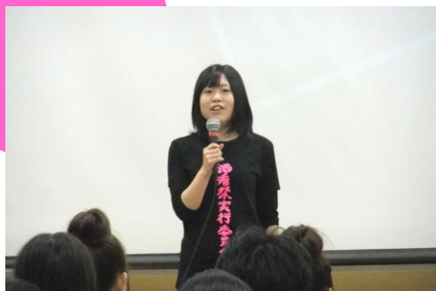
実行委員よりあいさつ