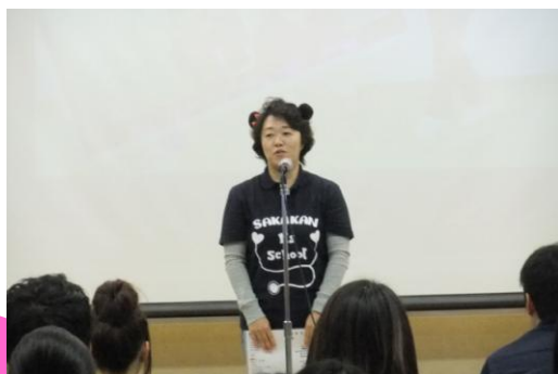
草刈副学校長です。