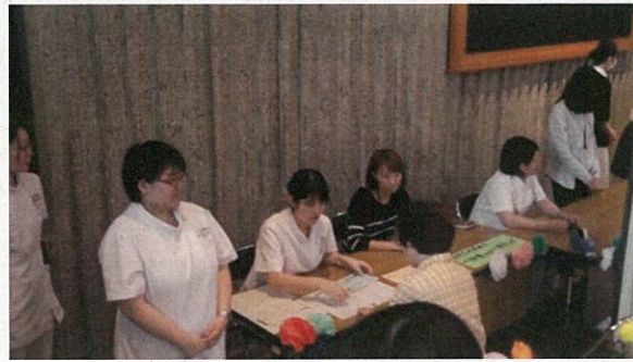
文化センターも大盛況でした(^0^)/