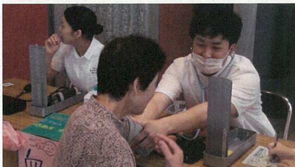
血圧測定の様子です