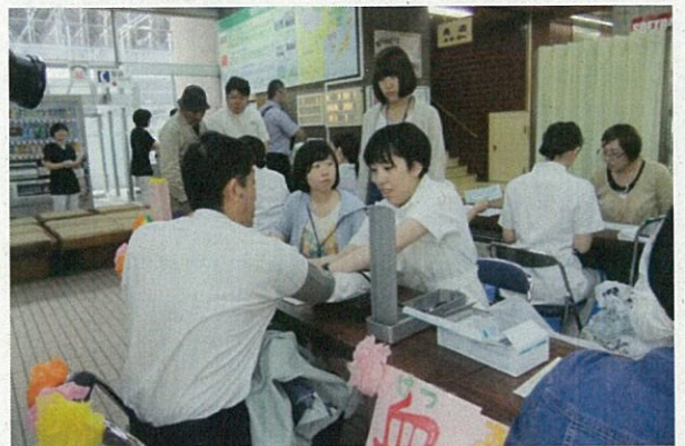
血圧測定、真剣な表情です！