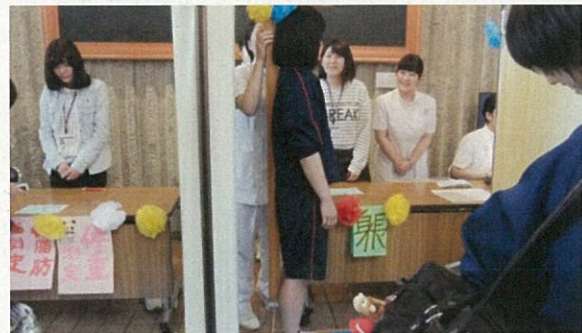
身長測定の様子です