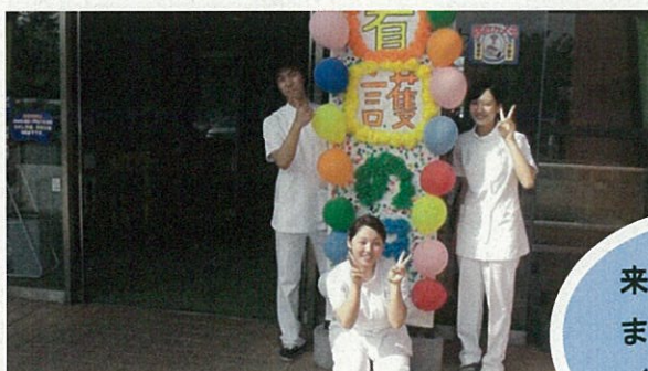
来年も頑張ります！！ (^v^)