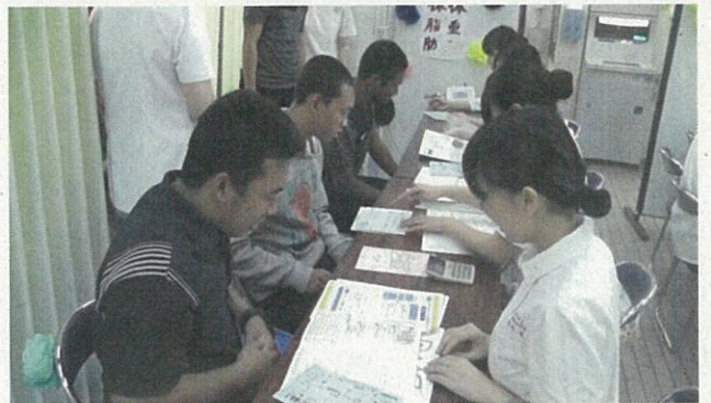
外国のお客様もきてくれました(^_^)/