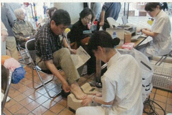
骨密度測定も大人気でした！！