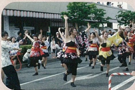
5月20日 まつりパレード参加