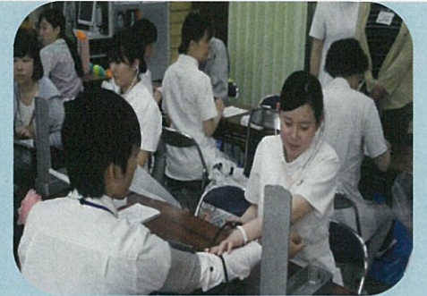
5月 看護の日 市役所ロビー