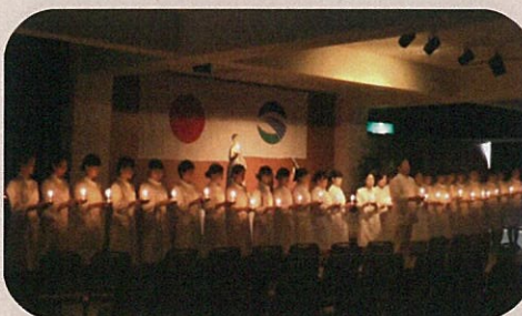
7月 「宣誓式」で誓いを心に