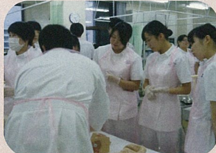
学校3階 実習室での研修