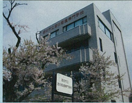
酒田市立酒田看護専門学校