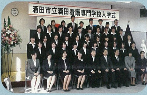
平成27年4月 6回生入学式