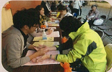
10月 「酒看祭」中町モール