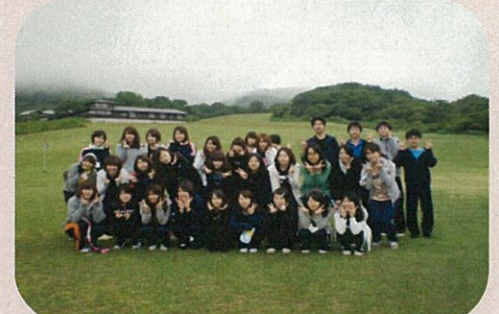
6月 新入生 宿泊研修