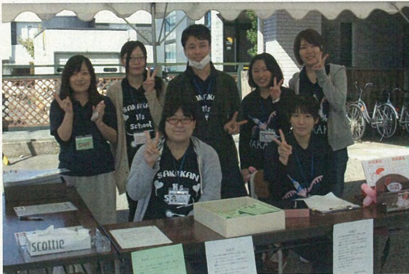
受付です。笑顔でお迎えします。