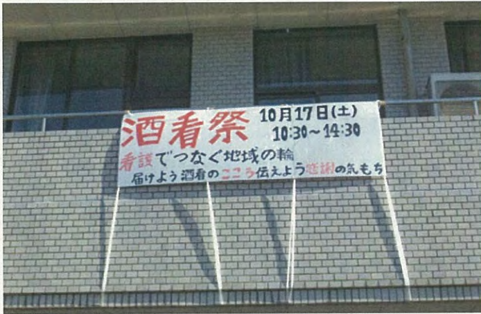
看板もばっちりです。

今年も平成27年10月17日(土)に『看護でつなく地域の輪～届けよう酒看のこころ、伝えよう感謝の気持ち～』のスローガンで、酒看祭を行いました。