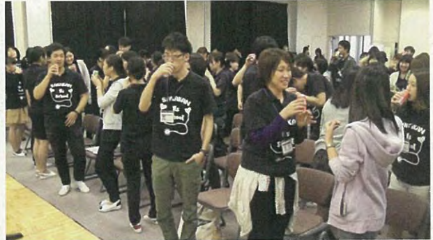
ジュースで乾杯しました。みなさんお疲れさまでした。