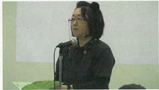
副学校長より講評をいただきました。