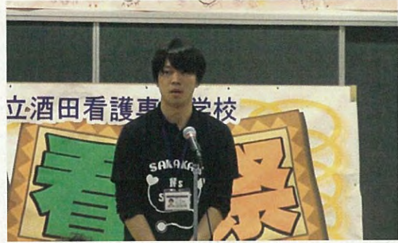
自治会長よりあいさつ