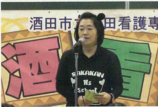
草刈副学校長から激励の言葉です。