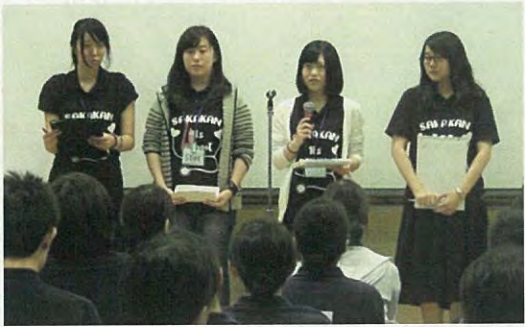
各班のリーダーより業務評価の発表です。