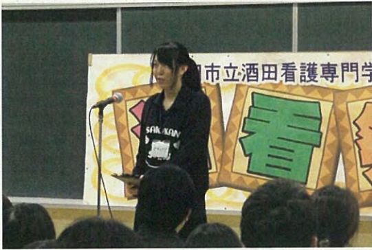
実行委員長よりあいさつ