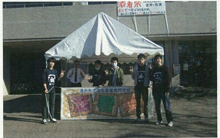
テントの準備も万端です。