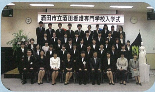
平成28年4月 7回生入学式