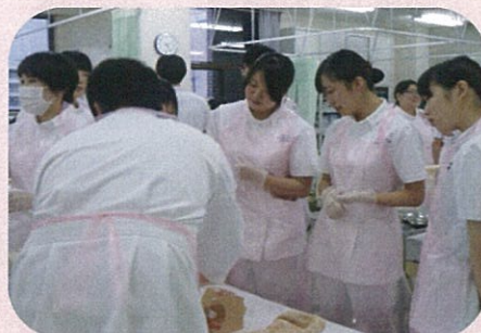
学校3階実習室での研修