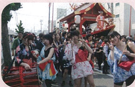
5月20日 まつりパレード参加