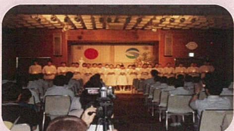
7月 「宣誓式」で誓いを心に