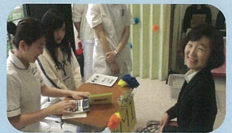
5月 看護の日記念行事 市役所ロビーで副市長も参加