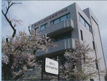
酒田市立酒田看護専門学校