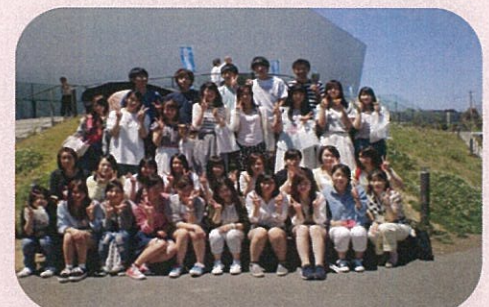
6月 新入生 宿泊研修