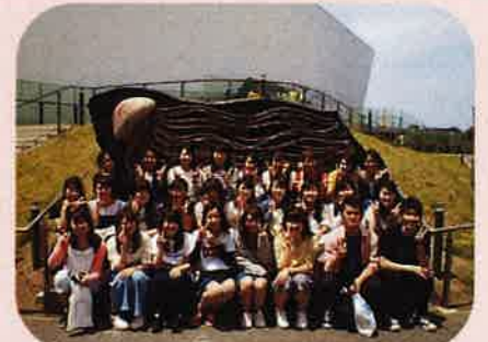
6月 新入生(8回生)宿泊研修