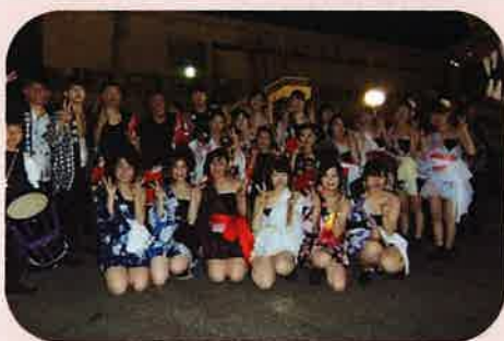
5月19日酒田祭り前夜祭に参加