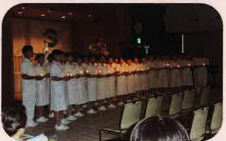
7月 「宣誓式」で誓いを心に