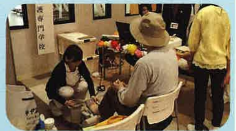
5月 看護の日記念行事 中町にぎわいプラザで骨密度の測定中