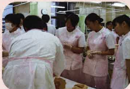
学校3階 実習室での授業