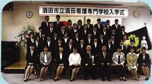
平成29年4月 8回生入学式