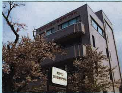
酒田市立酒田看護専門学校