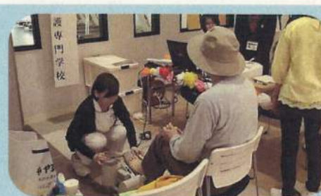
5月 看護の日記念行事 中町にぎわいプラザで骨密度の測定中