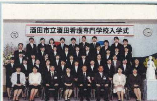
平成30年4月 9回生入学式

申込み / 7月2日より各オープンキャンパス開催日の前日までとしますが、定員30名になり次第締め切りますので、お早めに電話にて看護専門学校へ ☎0234-24-2260