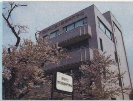
酒田市立酒田看護専門学校