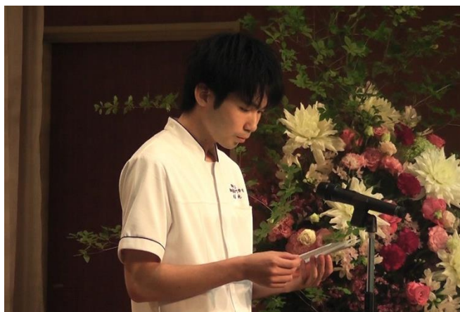
第8回生（2年生）代表挨拶