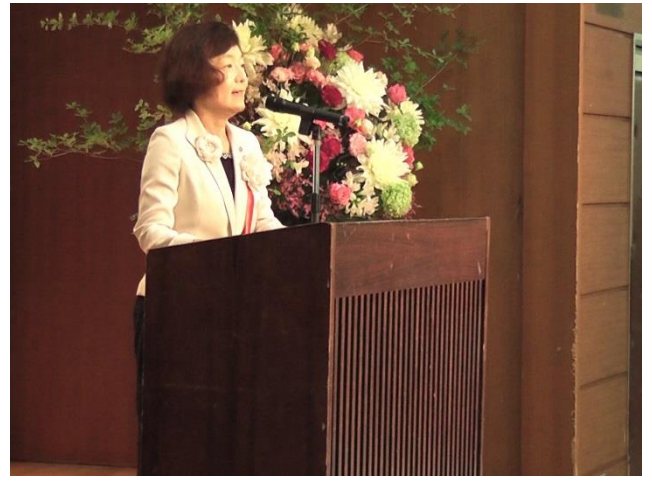
酒田市副市長 お祝いの言葉