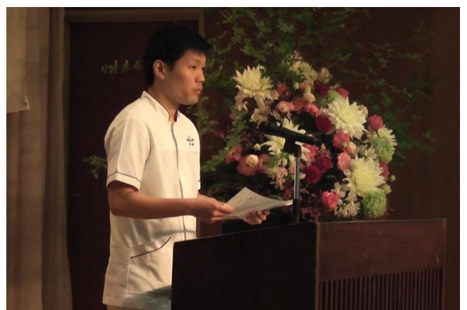
第7回生（3年生）激励の言葉