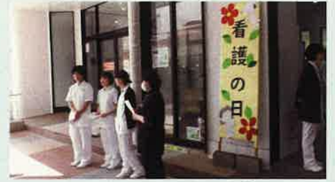
5月 看護の日記念行事