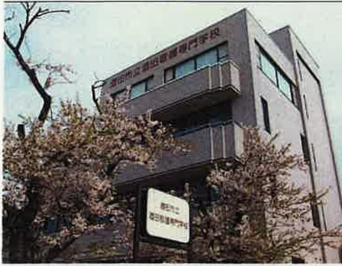
酒田市立酒田看護専門学校