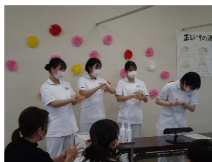
手洗い講座です。汚れは落ちたかな？