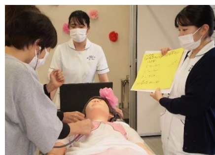
看護体験ブースです。聴診器で人形の呼吸音を聞いています。