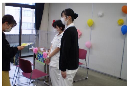
身長・体重・BMIで健康チェックです。