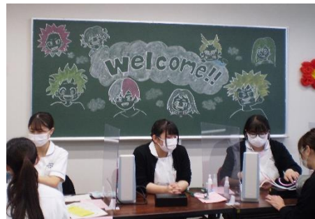
血圧測定です。頑張って測定しています。