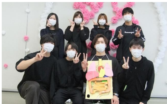
人体模型パズル、健康クイズも行いました。