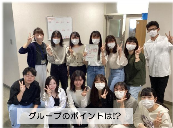
グループのポイントは!?