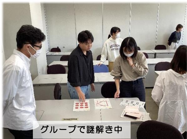
グループで謎解き中