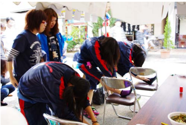
先輩、お手柔らかに。