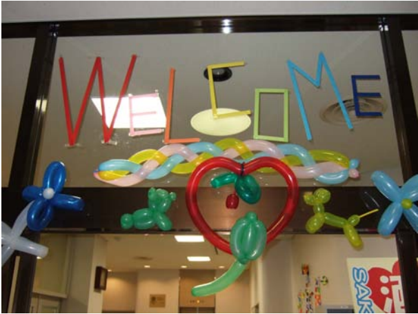
ようこそ！第1回酒看祭へ！！