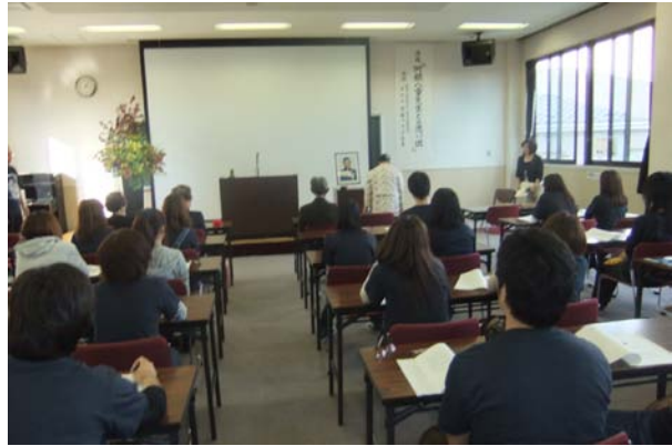
講堂、後ろよりの講演会場、これから講演が始まります。