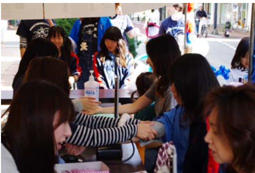
だんだん忙しくなってきたぞ——。