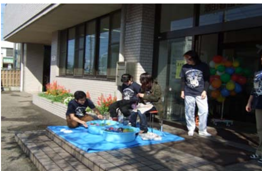
ヨーヨーつり寄っといで〜〜\(^o^)/