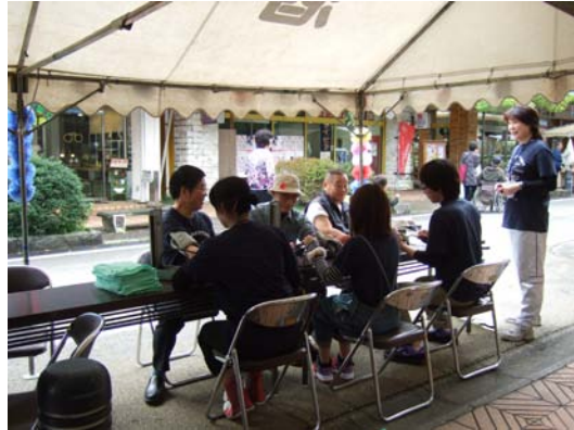
測る方もドキドキ♥測られる方もドキドキ♥