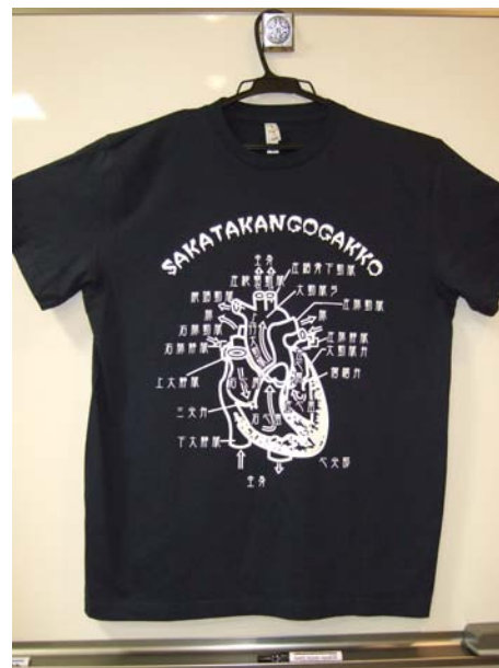
ちょっとグロテスク…？