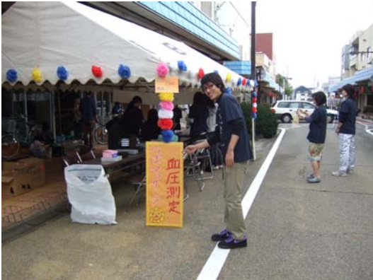
アピール中♥ 酒看のプリンスです♥