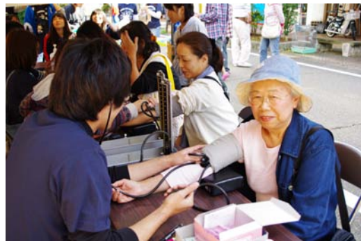
プロの腕前に近づいたかな！？