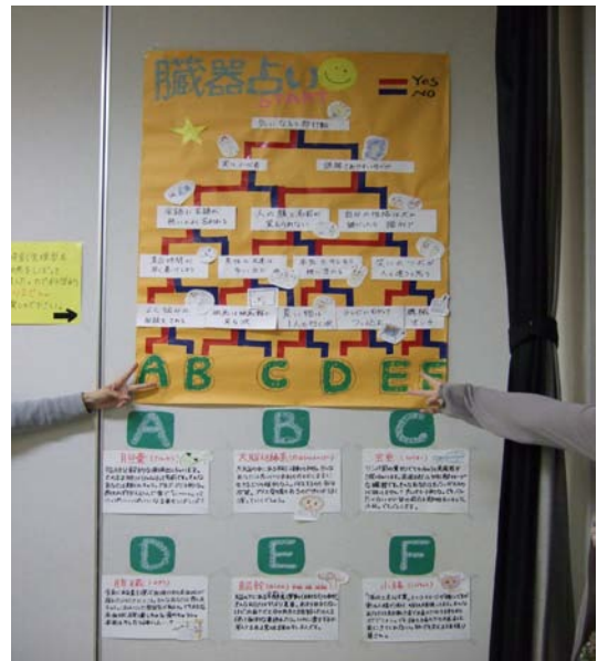
えー！以外！一緒じゃん！！ 私、当たってるかも…。