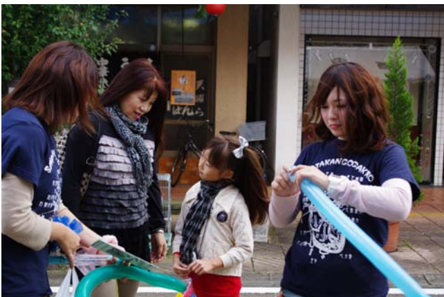
バルーンアート、何がいい？