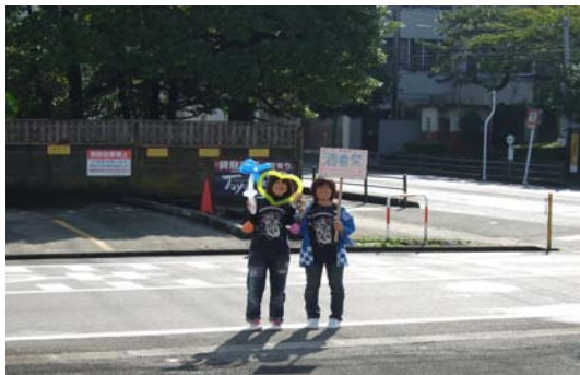
呼び込み行ってきたmars(^.^)〜〜