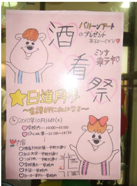
ポスターかわいいの♡