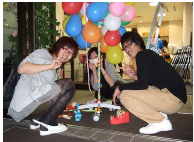
点滴台をデコレーション (*^_^*)