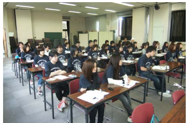
地域を支える明日の看護師を目指し、熱心に聴き入っています(..)φメモメモ