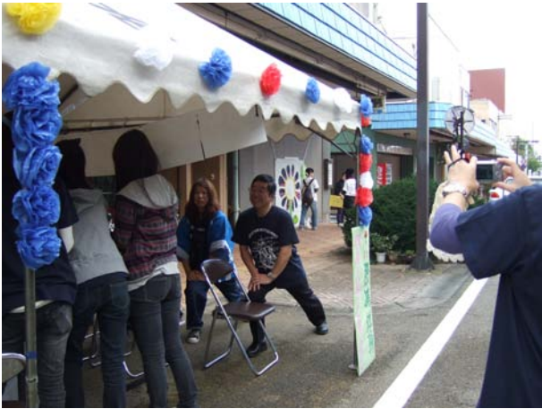
腰痛予防体操を教えています。