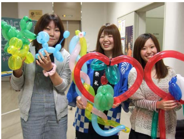
バルーンアート完成♡かわいいでしょ。