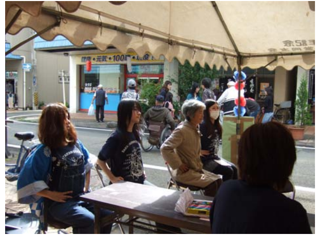
人に教えるのって緊張するっ(>_<)